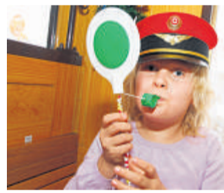
Obacht, Trillerpfeife: Ärzte warnen vor Hörschäden.

Eine Babyrassel, die nah ans Ohr gehalten wird, kann nach seinen Angaben mit 93 Dezibel lauter sein als ein vorbeifahrender Zug. Auch eine Quietsche-Ente könne direkt